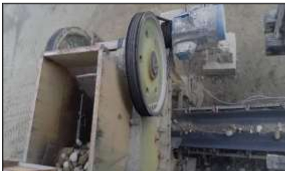
Gambar 5. Sirtu diremukan di Primary Crusher

Material hasil olahan primary crusher kemudian diangkat ke secondary crusher menggunakan conveyor . Pada secondary crusher material dihancurkan kembali dan dibawa oleh conveyor menuju vibrating screen . Material yang berada pada vibrating screen kemudian dipisahkan oleh screen yang berjumlah empat dek.