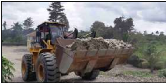
Gambar 3. Wheel Loader memuat sirtu ke Hopper

Alur tahapan pengolahan sirtu diawali dengan material yang ditumpahkan oleh Wheel Loader ke hopper . Selanjutnya melalui feeder material disalurkan ke primary crusher .