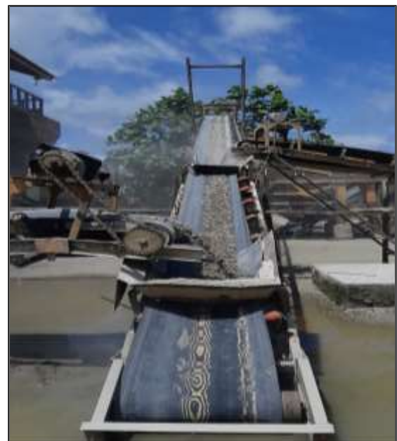
Gambar 6. Belt Conveyor

Material yang lolos pada dek pertama dan tertahan di dek kedua diangkat oleh conveyor sebagai fraksi pertama. Material yang lolos pada dek kedua dan tertahan di dek ketiga adalah fraksi kedua. Material yang lolos pada dek ketiga dan tertahan di dek keempat diangkat oleh conveyor adalah fraksi ketiga. Material yang lolos pada dek keempat merupakan fraksi abu batu.