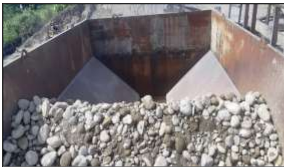
Gambar 4. Sirtu pada Hopper