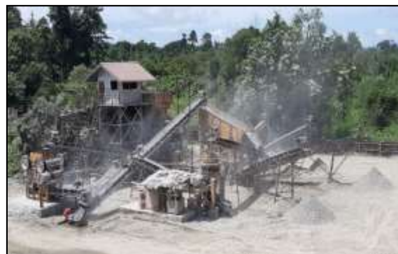
Gambar 1. Unit Crushing Plant

Pengolahan sirtu pada unit crushing plant PT. Pusaka Dewa Kresna menggunakan primary crusher yakni jaw crusher , secondary crusher , cone crusher dan screen empat dek.